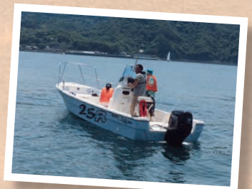
富士ボートテイング試乗会

そんな中で今後の成約に繋がるホットな商談も数多くあり、とても有意義な試乗会となりました。(マリン関東/飯島)